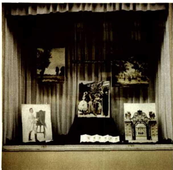
Das Photogeschäft Simonis in der Wallensteinstraße 33

FOTOGRAFIERTE PORTRATS ANSTELLE VON ÖLBILDERN, das wurde ab Mitte des 19. Jahrhunderts vor allem im vermögenden Bildungsbürgertum immer beliebter. Die Hochblüte erlebte die Porträtfotografie im 20. Jahrhundert und in Österreich hatte das Photostudio Simonis einen großen Anteil daran.