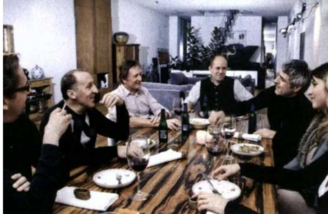
BODENSTÄNDIGES. Wurde für „Die Seele der österr. Küche“ nachgekocht.

tors eher für Rauchkuchln als für moderne Küchenstudios brennt.